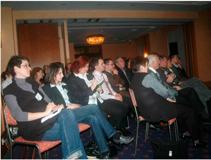
Ein Referat, bei dem viel mitgeschrieben wurde