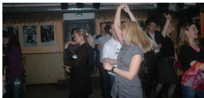
Die Sarrasani-Lounge tanzt Salsa