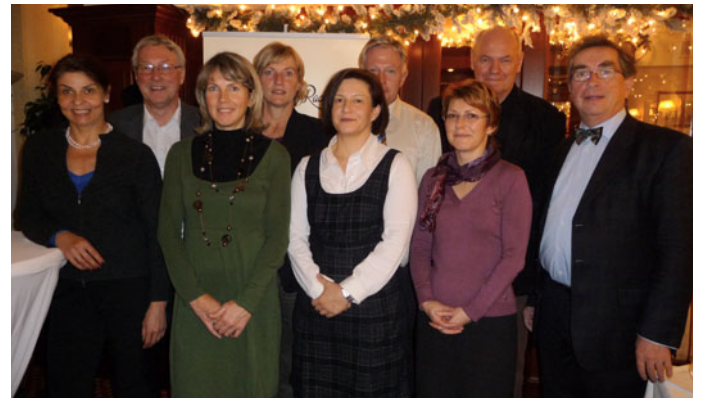
Der neu gewählte Vorstand des Presseclubs