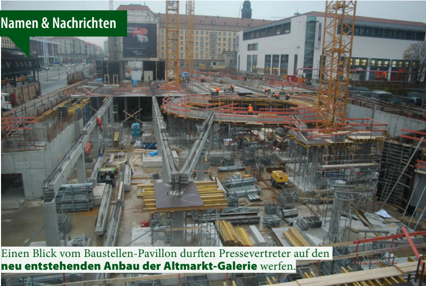
Einen Blick vom Baustellen-Pavillon durften Pressevertreter auf den neu entstehenden Anbau der Altmarkt-Galerie werfen.